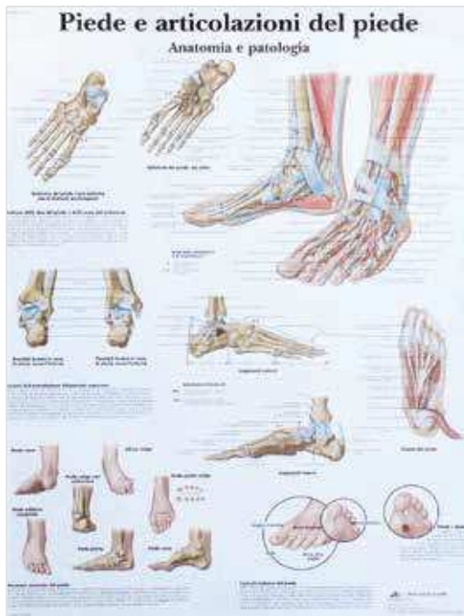
CS4176 Poster 50 X 67 cm - Articolazione piede e caviglia