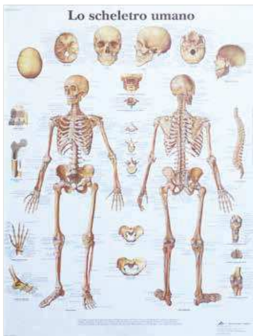
CS4113 Poster 50 X 67 cm - Lo scheletro umano