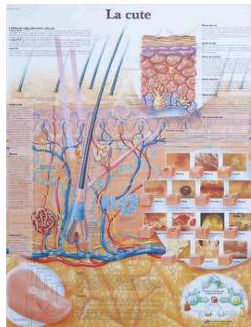
CS4283 Poster 50 X 67 cm - La pelle