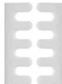
SAAC102 Confezione 2 pezzi