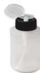
YO.77046 Per liquidi