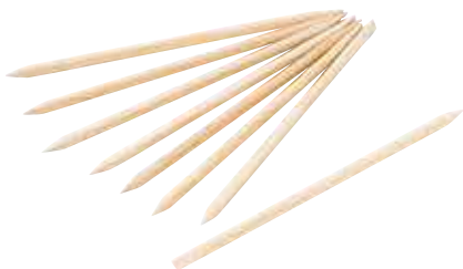
KS476 Confezione 10 pezzi - 13 cm