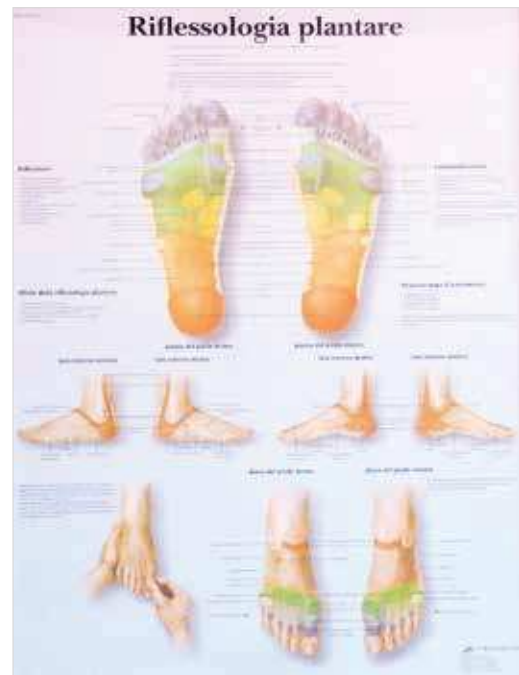
CS4810 Poster 50 X 67 cm - Riflessologia plantare