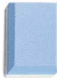
EP311 Spugnetta con superficie regolare e grana finissima.