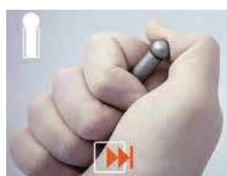
PREMI A FONDO