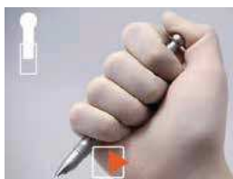
PREMI A META

È DISPONIBILE IL TUTORIAL ON LINE! CHIEDI INFORMAZIONI