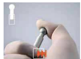
PREMI A META